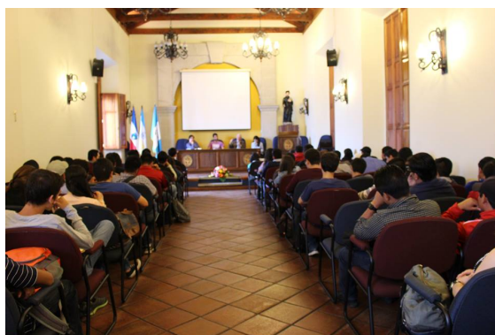
Pie de foto: Cineforo "Plaza 44-15" con participación de IDGT, Plaza Pública y Brújula

El Instituto de investigación y proyección sobre el Estado (ISE), el Instituto de Investigación y Proyección sobre Dinámicas Globales y Territoriales (IDGT), el Instituto de Investigación y Proyección sobre Diversidad Sociocultural e Interculturalidad (ILI), la Revista de Investigación y Proyección Eutopía, el medio de comunicación Plaza Pública y la revista digital Brújula, participaron en el Segundo Congreso de Estudios Mesoamericanos celebrado del 27 al 30 de julio en la ciudad de Quetzaltenango, a través de diferentes conversatorios, mesas temáticas, conferencias, presentaciones y cineforos.